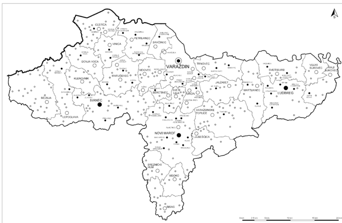
Slika 1: Karta Varaždinske županije